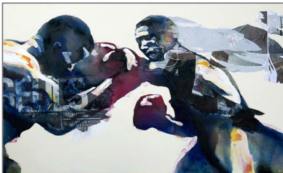
Seuls , acrylique et collage, 2009, 196 x130 cm

Musée des Arts Derniers 28, rue Saint-Gilles 75003 Paris 01 44 49 95 70 www.art-z.net