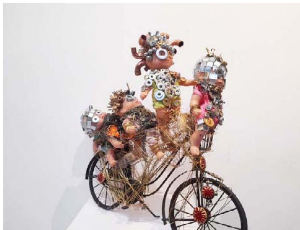
Easy Riders, 2017, Matériaux divers, 44 x 41 x 14 cm.

Étincelants de mille riens, coiffés de petits clous et de fils de fer dorés, à peine perceptibles, intenses et modestes par soustraction, revoilà les vibrants petits personnages de l'univers d'Olivier Sultan, avec leur cortège singulier. Sur la pointe des pieds, le petit peuple des Dudes, leurs valises-mémoire et leurs totems hybrides, refont ici surface le temps d'une exposition à la Galerie Art-Z.