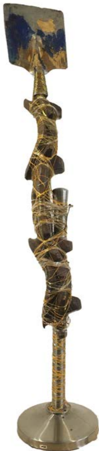
Totem, 2018. Matériaux divers, 178 x 25 cm

Michel Camain, in Catalogue d'inauguration du Musée des Arts Derniers, éditions MAD, 2002