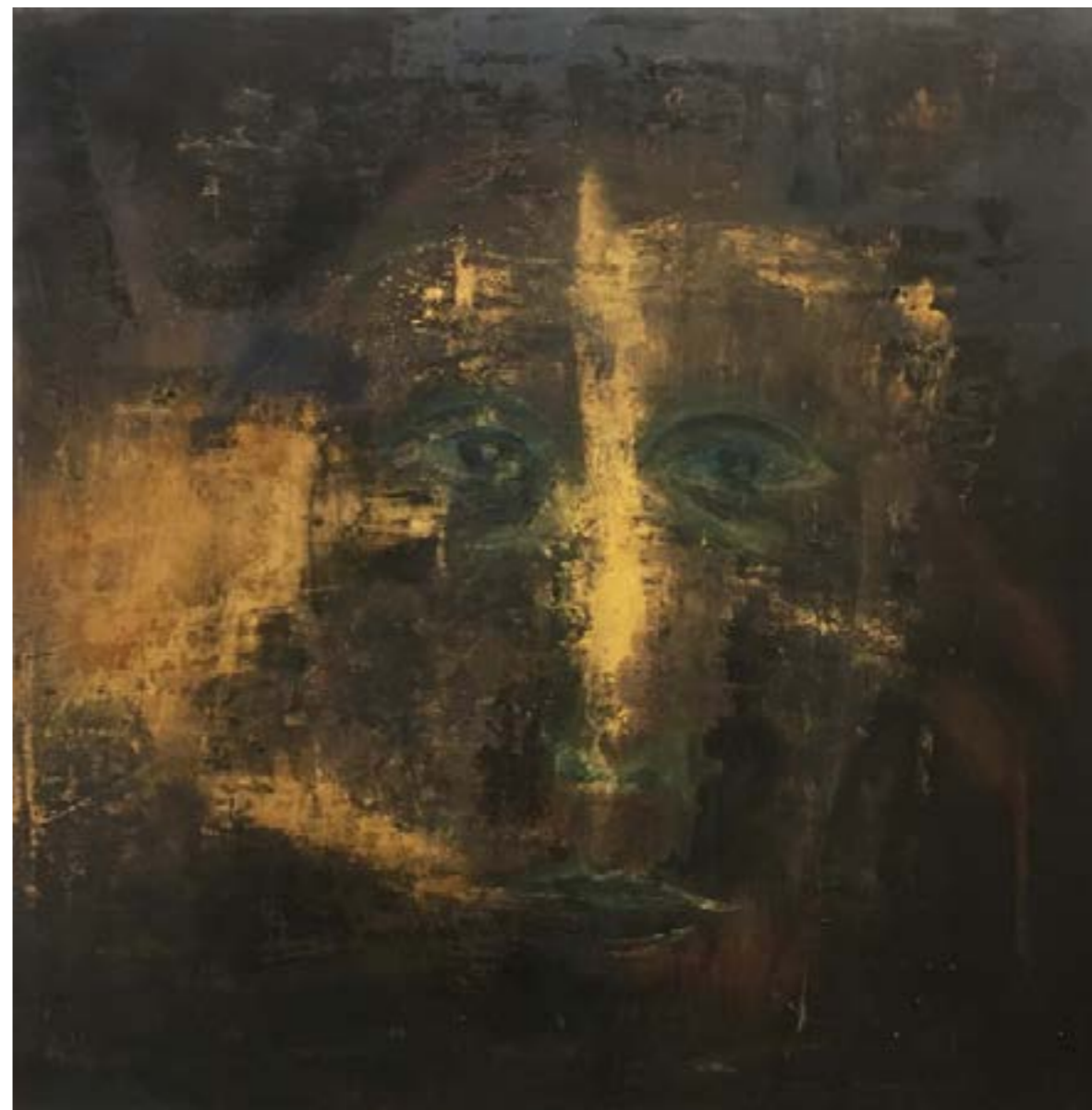
Série Les Effacés , 2022, Feuille d'or, acrylique et pigment sur toile, 100 x 100 cm

Hanté par le thème de l'effacement et de la disparition, Olivier Sultan présente également une série de portraits récents et des photographies qui se situent « en deçà du temps ». Sultan revendique ainsi la « tentation d'être moindre, dans l'effacement, dans la discrétion, aux confins de la disparition ».