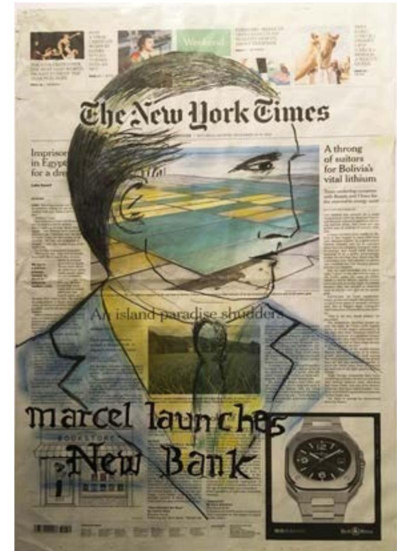
Série Banque «Ducell-Marchant», 2021, Collage sur papier, 56 x 36 cm

Olivier Sultan – Les Dudes et Oeuvres récentes 2018-2022 du 27 janvier au 26 février Entrée libre - Du mercredi au samedi, de 14h à 19h.